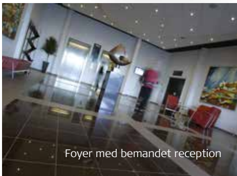
Foyer med bemanded reception