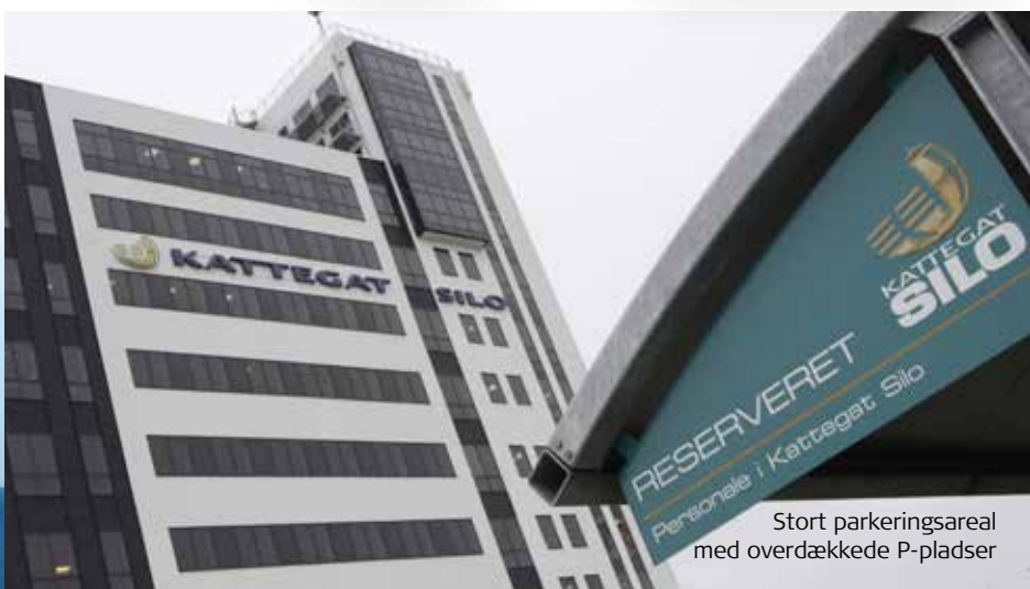
Stort parkeringsareal med overdækkede P-pladser