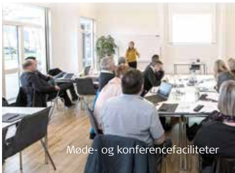
Møde- og konferencefaciliteter