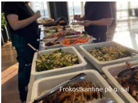
Frokostkantine på 9. sal